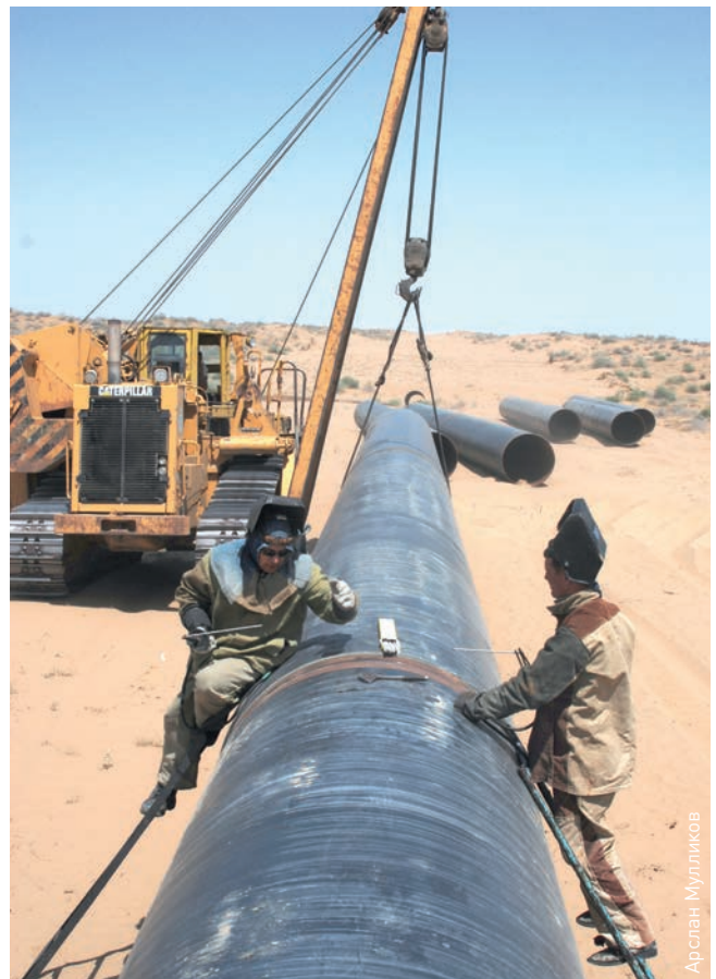
На территории Туркменистана трасса газопровода ТАПИ проходит в основном по пустыне Каракумы

Издание также сообщает, что в соглашении о купле-продаже газа, подписанном между сторонами в 2013 году, определен механизм ценообразования, при котором цена на газ на границе Туркменистана будет примерно на 20% ниже, чем цена на нефть марки Brent на момент поставок газа.